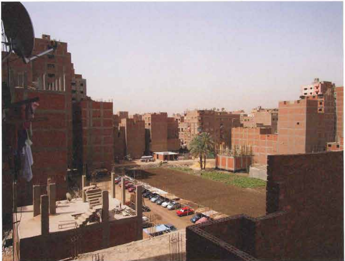
1 Ard-el-Liwa, Le Caire. Résidus de parcelles agricoles encore cultivées.

aggravée au point de menacer de disparition une terre agricole déjà rare.