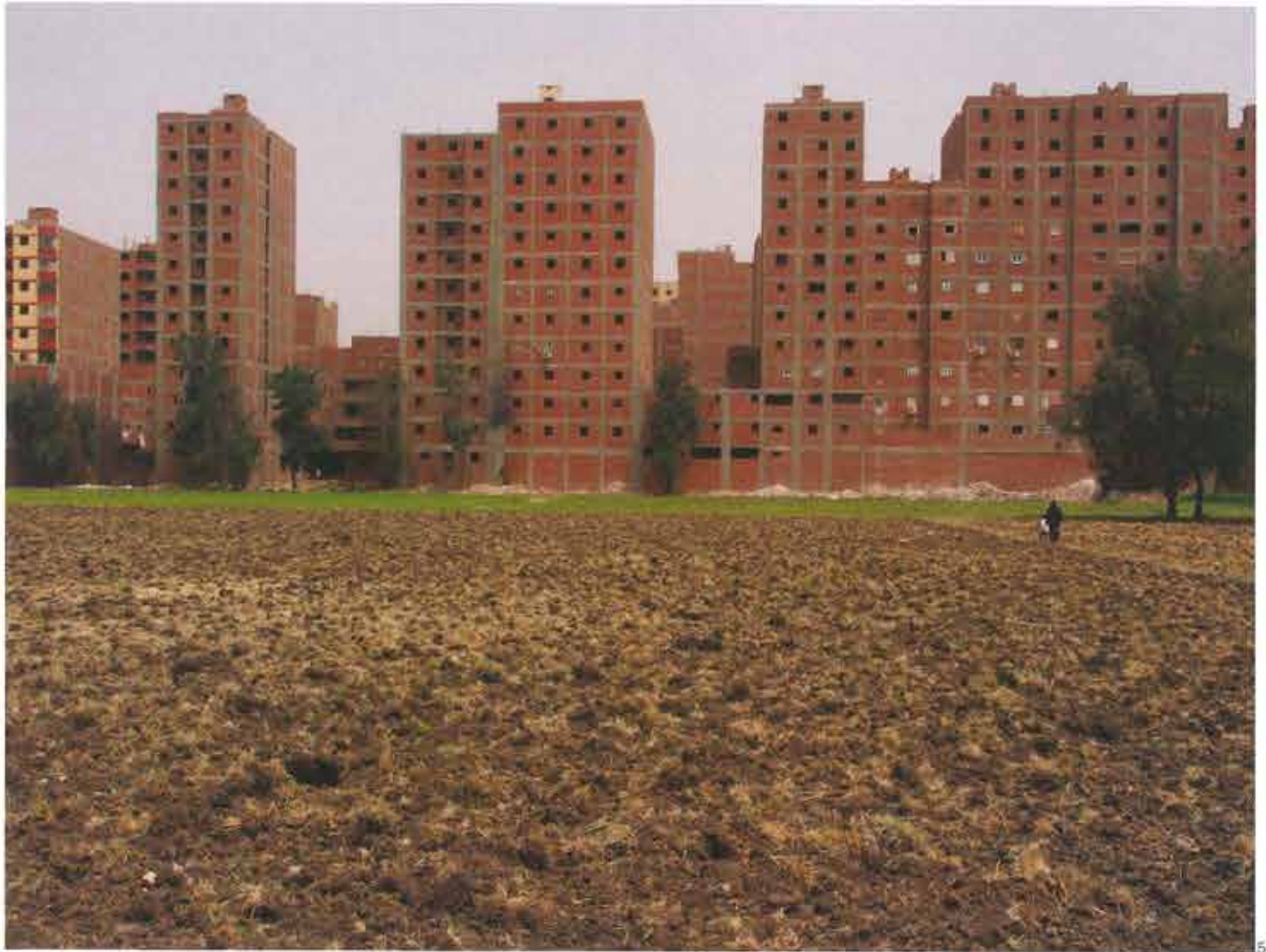
5 Meriutya, Le Caire. Constructions récentes surplombant des champs

les importations de produits alimentaires bon marché par des subventions pour l'alimentation en zone urbaine a contribué à l'accélération de la croissance urbaine et à l'augmentation des besoins en logements, qui à son tour a conduit à la subdivision informelle de la terre agricole au Caire et dans le delta du Nil 17 . Ce phénomène se traduit par une concurrence territoriale incontestable entre l'espace urbain et agricole 18 .